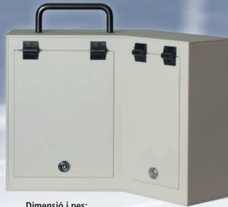
Dimensió i pes: 37 x 26 x 23 cm, - aprox. 3Kg