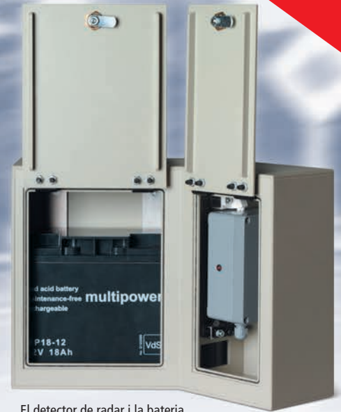
El detector de radar i la bateria estan darrere de les tapes frontals.